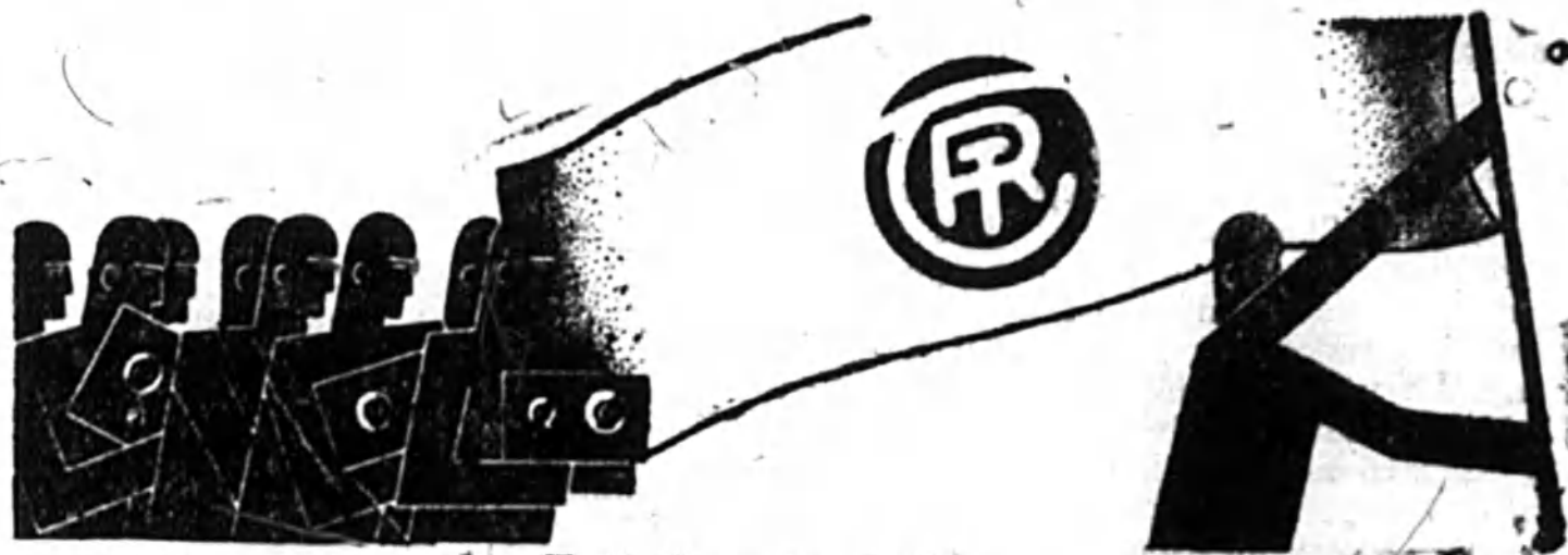
Csatlakozzék Ön is és csorbíja be rúdóját a

A jegyek túlnyomó része elő van jegyezve, de még mindig kaphatók egy pengős és néhány 2 pengős jegy délután a pénztárnál, a nagyterem mellett. Az előjegyzések vizsgálata