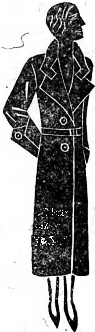
Legelegánsabb a Schütz-kabát.

— Felépül a pécsi rádió reléállomás. A pécsi rádió reléállomás felépítése körül nehézségek merültek fel; többek közt nagy nehézségekbe ütközött a terület megszerzése. Ez az akadály is elhárult s most már néhány hét múlva hozzákezdenek a felépítési munkálatokhoz.